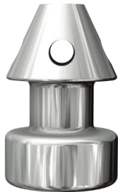
Figuur 1: I-stent, flink vergroot

Dit is een zeer klein implantaatje dat bedoeld is om de oogdruk in een oog te verlagen. Dit implantaatje wordt operatief in het oog geplaatst, meestal in aansluiting op een staaroperatie.