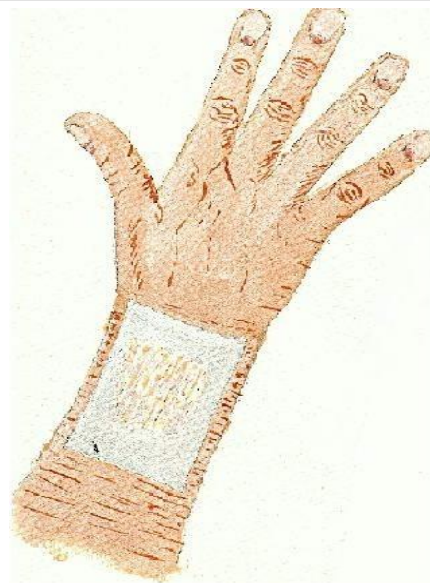
4.Zo kan de opgestroopte huid weer vastgroeien