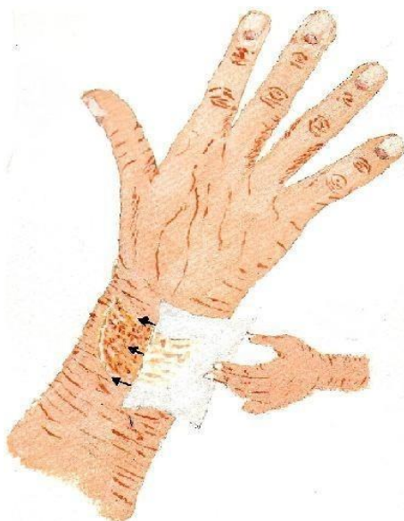
3.Leg de huidvriendelijke pleister ruim over de wond