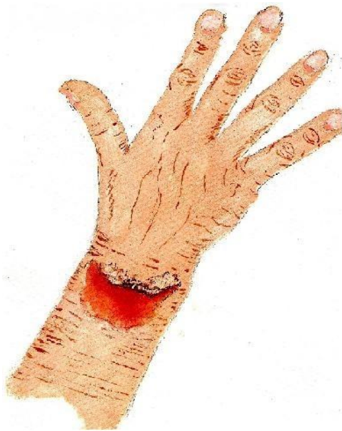
1.Wond met opgestroopte huid

Vraag aan uw huisarts of apotheker om huidvriendelijke siliconen pleisters voor een dunne kwetsbare huid.